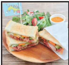
ヨッチャンズヘビーノッチ ¥650 自家製ピクルスとコンビーフを挟んださっぱり味のサンドとサラダのプレート。