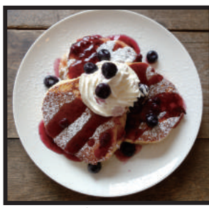
ブルーベリーパンケーキ ¥750