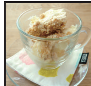
レモンチーズアイスクーキ ¥350 濃厚なチーズにレモンの酸味を効かせたコロコロ可愛いアイスクーキです。