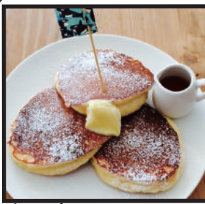
プレーンパンケーキ ¥600