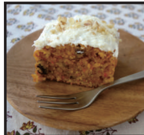
キャロットケーキ ¥350 しっとりしたほんのり甘いケーキに、酸味のあるクリームとナッツをのせました。