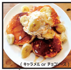
バナナパンケーキ ¥750 (キャラメル or チョコソース)