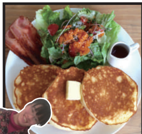
ミールパンケーキ ¥750