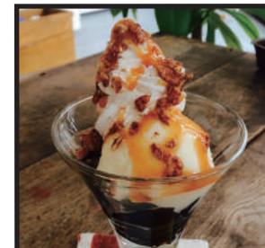
コーヒゼリーパフェ ¥500 ほろ苦ゼリーにアイスとホイップクリーム、キャラメルソースをかけました。

パンケーキ サンドイッチ スープ ⇒ご注文の方は、 こちらもお選び いただけます!