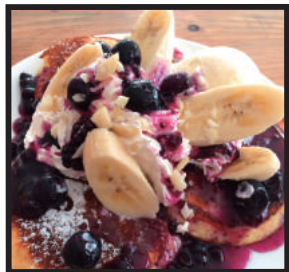
メガ盛りパンケーキ ¥1,100