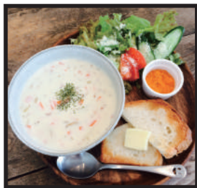
スープセット (クラムチャウダー or ミネストローネ) ¥750