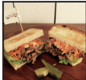
マイケル村田の 80's ノッチ ¥750 旨ダレに漬込んだ豚肉・人参・レタスに、一味マヨネーズソースを絡めたピリ辛サンド。